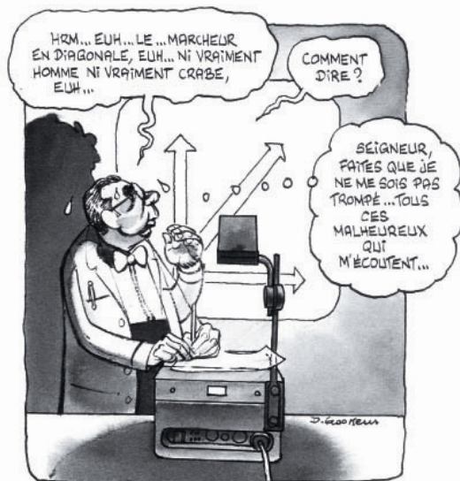
Rollin par 900ssens